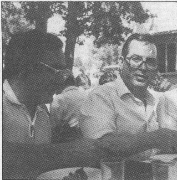
Berrio asistiu ó VII Coloquio Internacional da Historia da Educación.

—Polas circunstancias históricas da involución que tivemos que padecer nos anos seguintes, non se voltou te-la altura de plan proposto por Marcelino Domingo, até coarenta anos despois. O que supuxo un retraso importante nos mestres e no nivel cultural do país. Pero, hoxe en día, coido que a nosa meta non está na volta ó plan profesional. O que apuntaba Marcelino Domingo era unha formación universitaria, de cali-