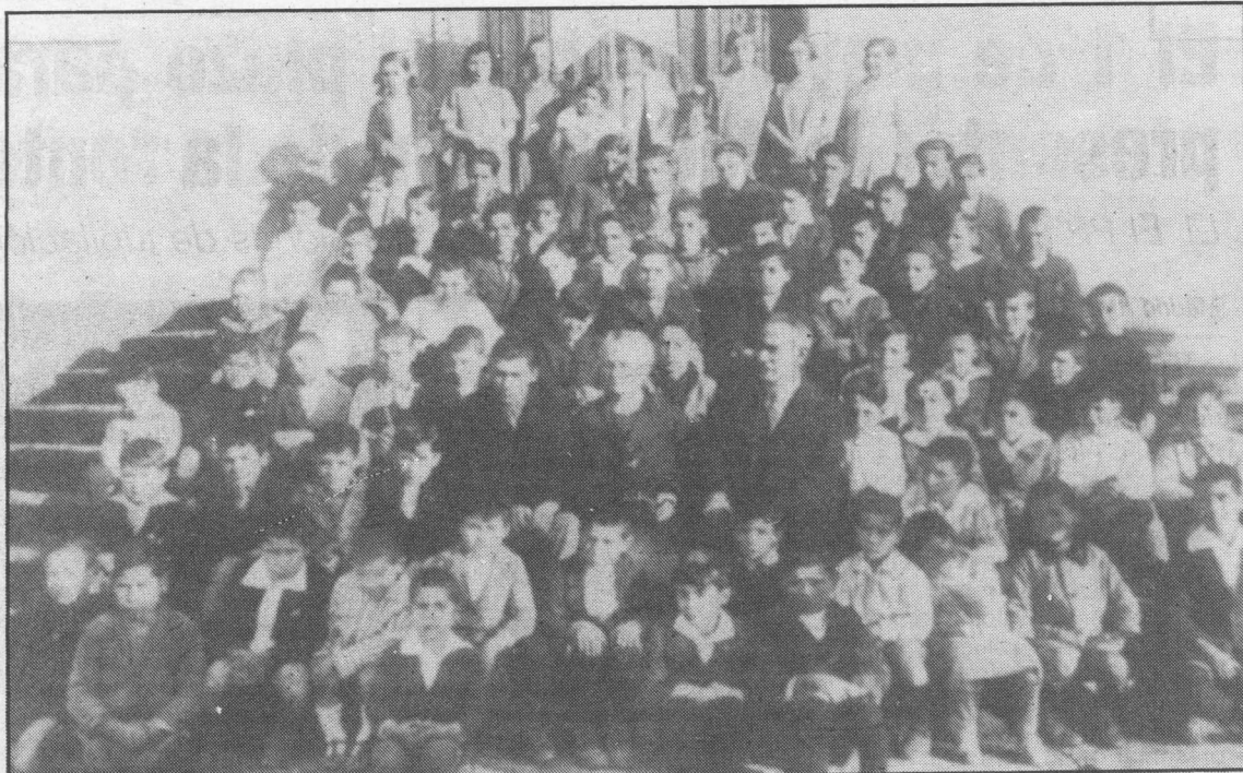
Alumnos e profesores da "Escuela Laica Neutral" no Ourense de 1926.