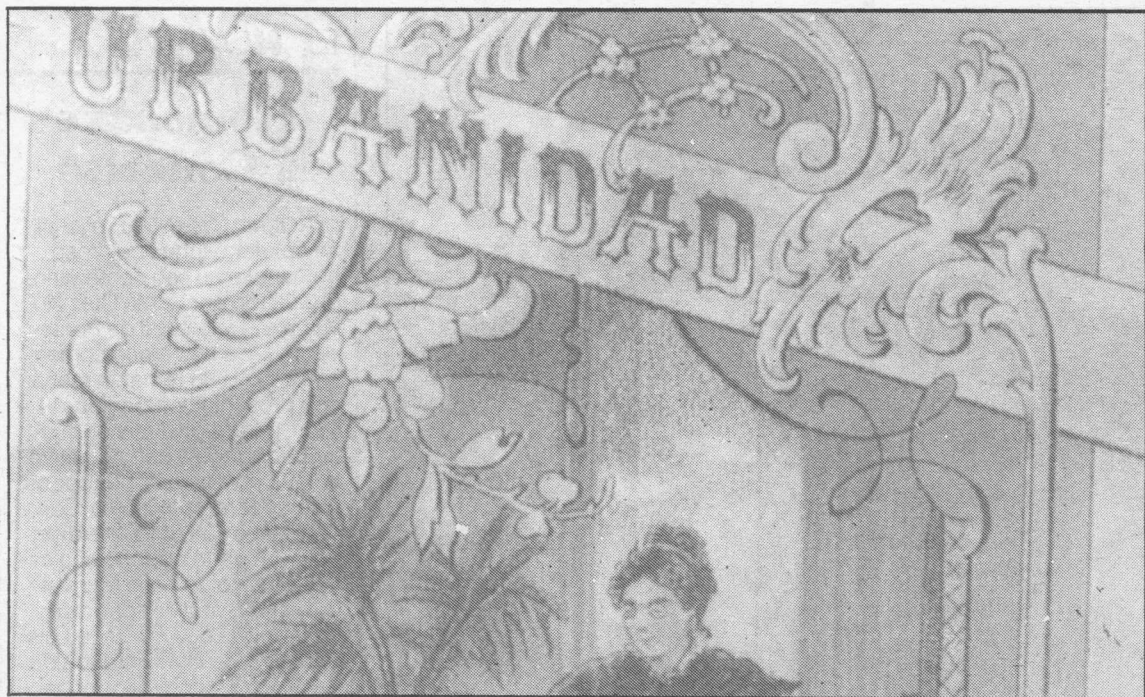
Portadas de libros de texto da época.

••• Frente ó anterior retómanse os vellos valores: patria, relixión, familia, autoridades, exército.