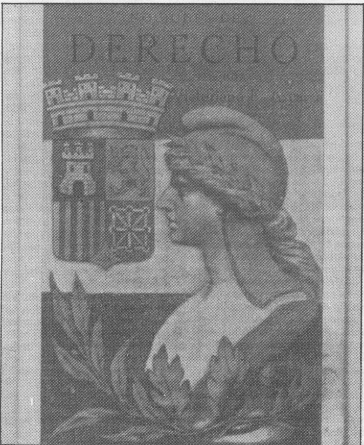
Portada de algúns libros de texto.